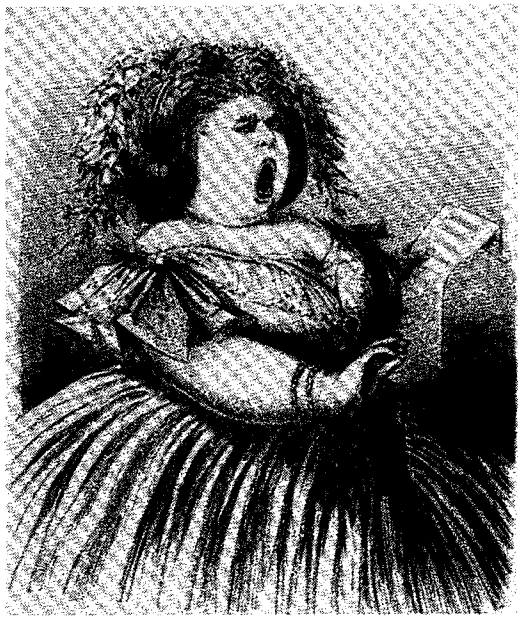
“Une cantatrice plus forte que l’Alboni.” 4 February 1860. Caricature by Carlo Gripp.