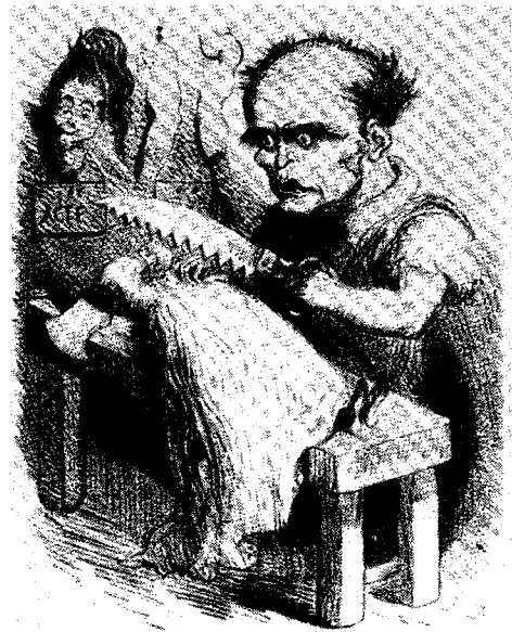
“Monsieur Scribe arrangeant Manon Lescaut.” 12 July 1856. Caricature by Marcellin.