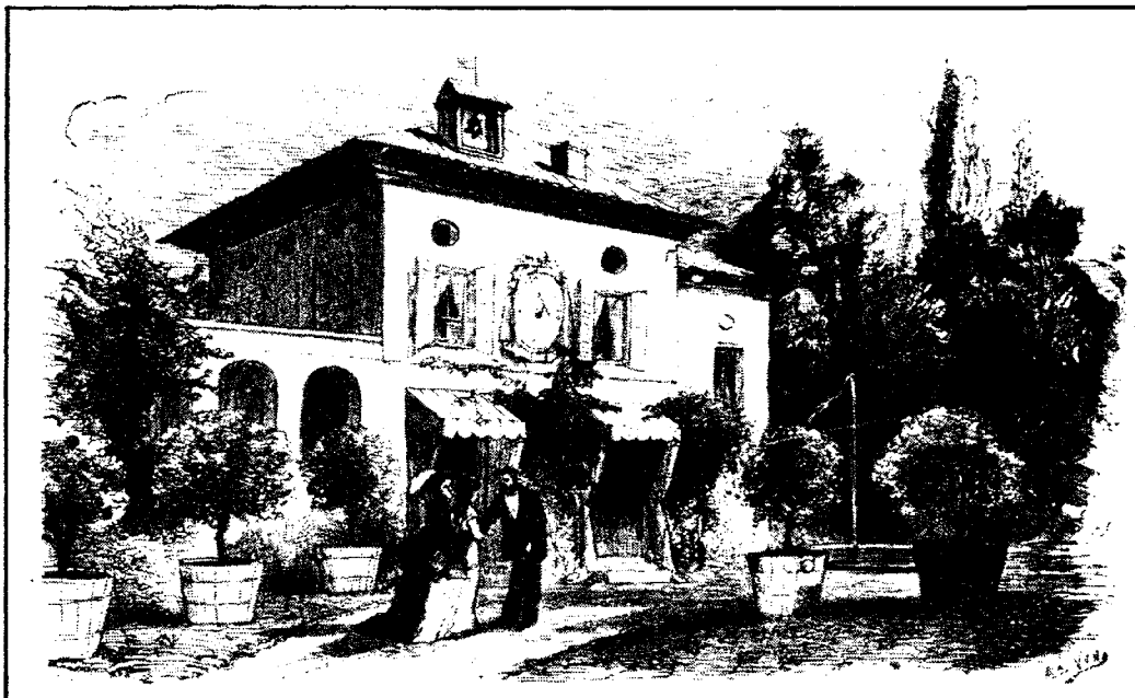
The Verdi villa in Busseto. — View of the villa and the gardens. L'Illustration , 13 June 1874. Signed, E D Yon.