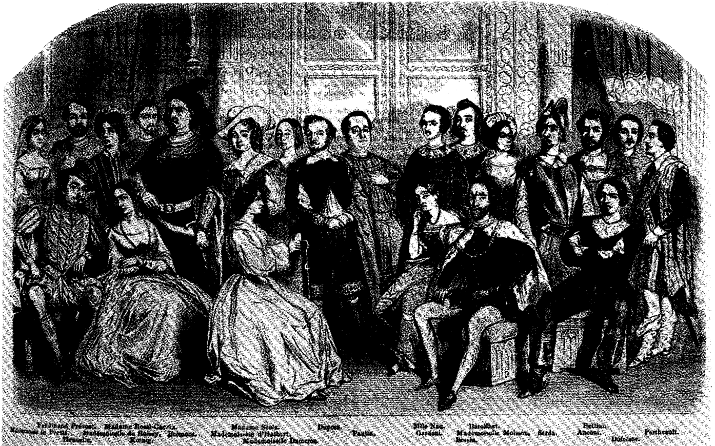
The Company of the Paris Opera in 1847. 11 September 1847. Unsigned.